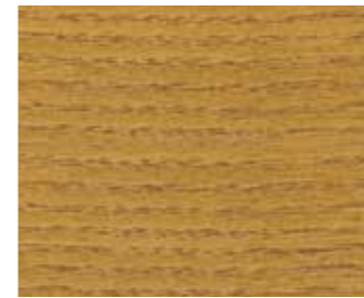
Eiche hell 868