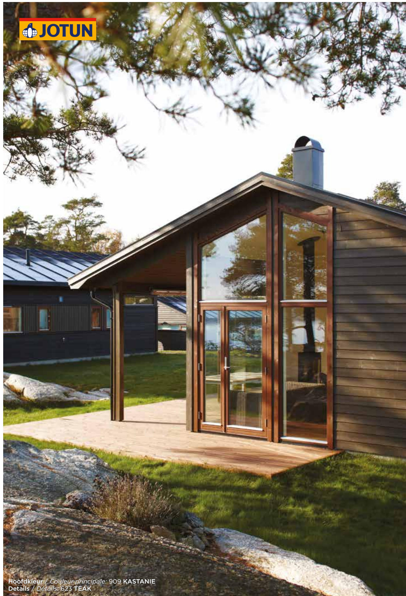
Hoofdkleur / Couleur principale: 909 KASTANIE Details / Détails: 623 TEAK