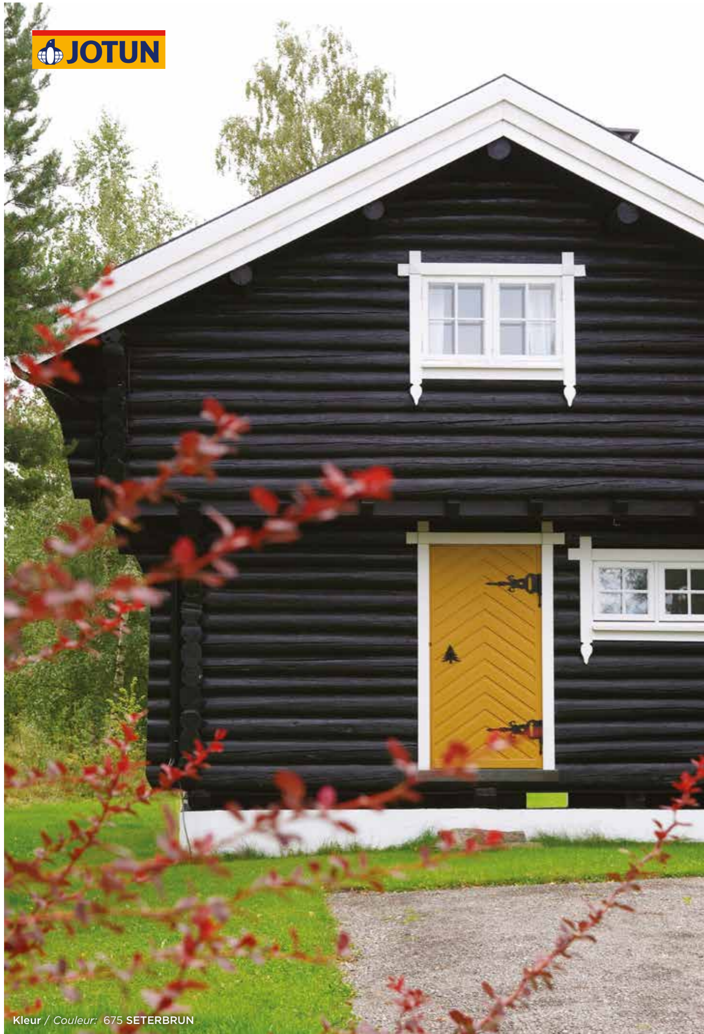
Kleur / Couleur: 675 SETERBRUN