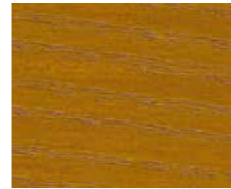
Eiche antik 10083