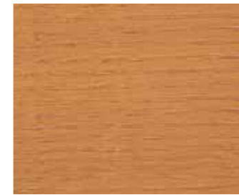
Sibirische Lärche 935