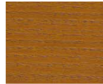
Eiche dunkel 10009