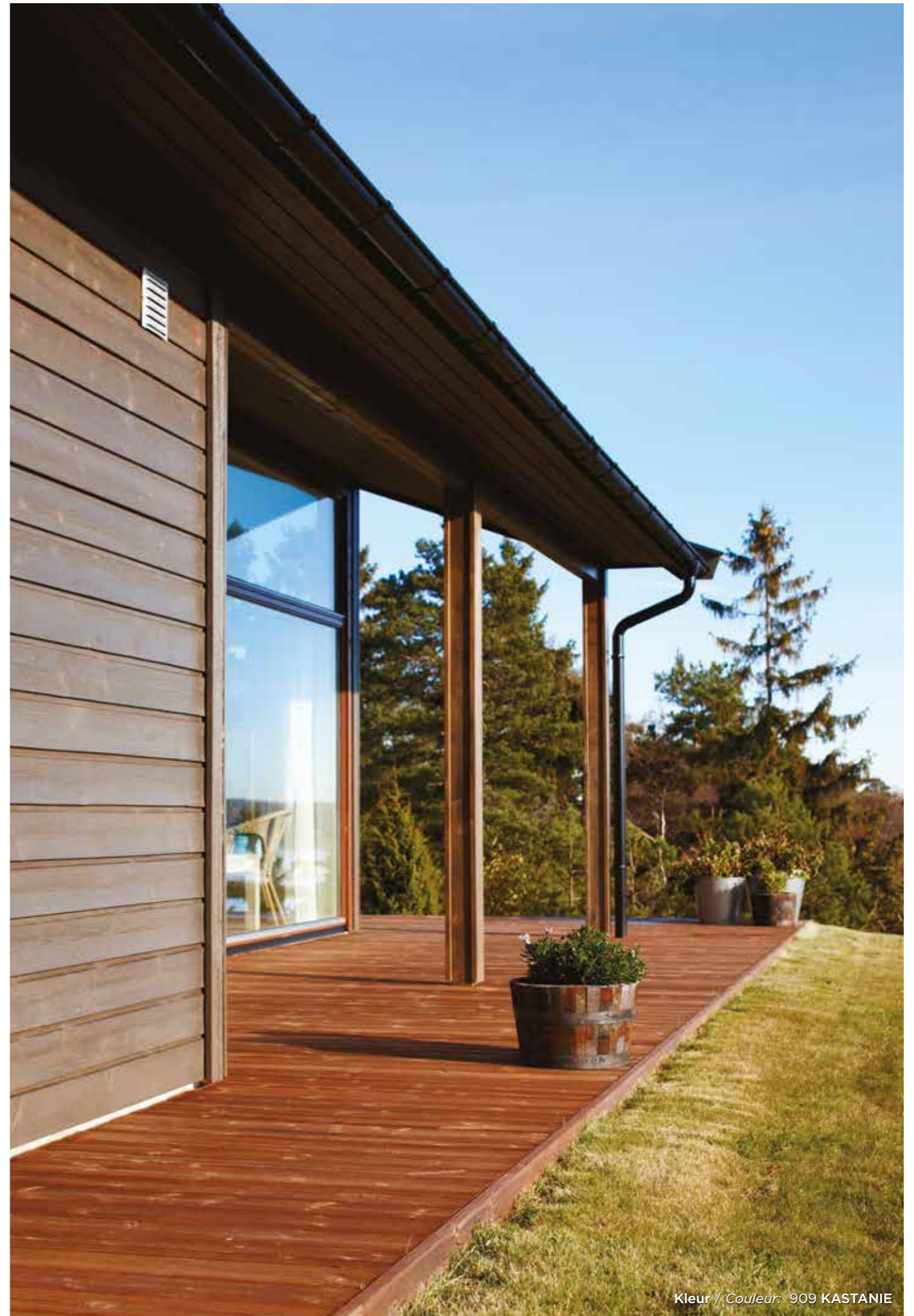
Kleur / Couleur: 909 KASTANIE