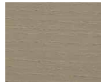
Silbergrau hell 934