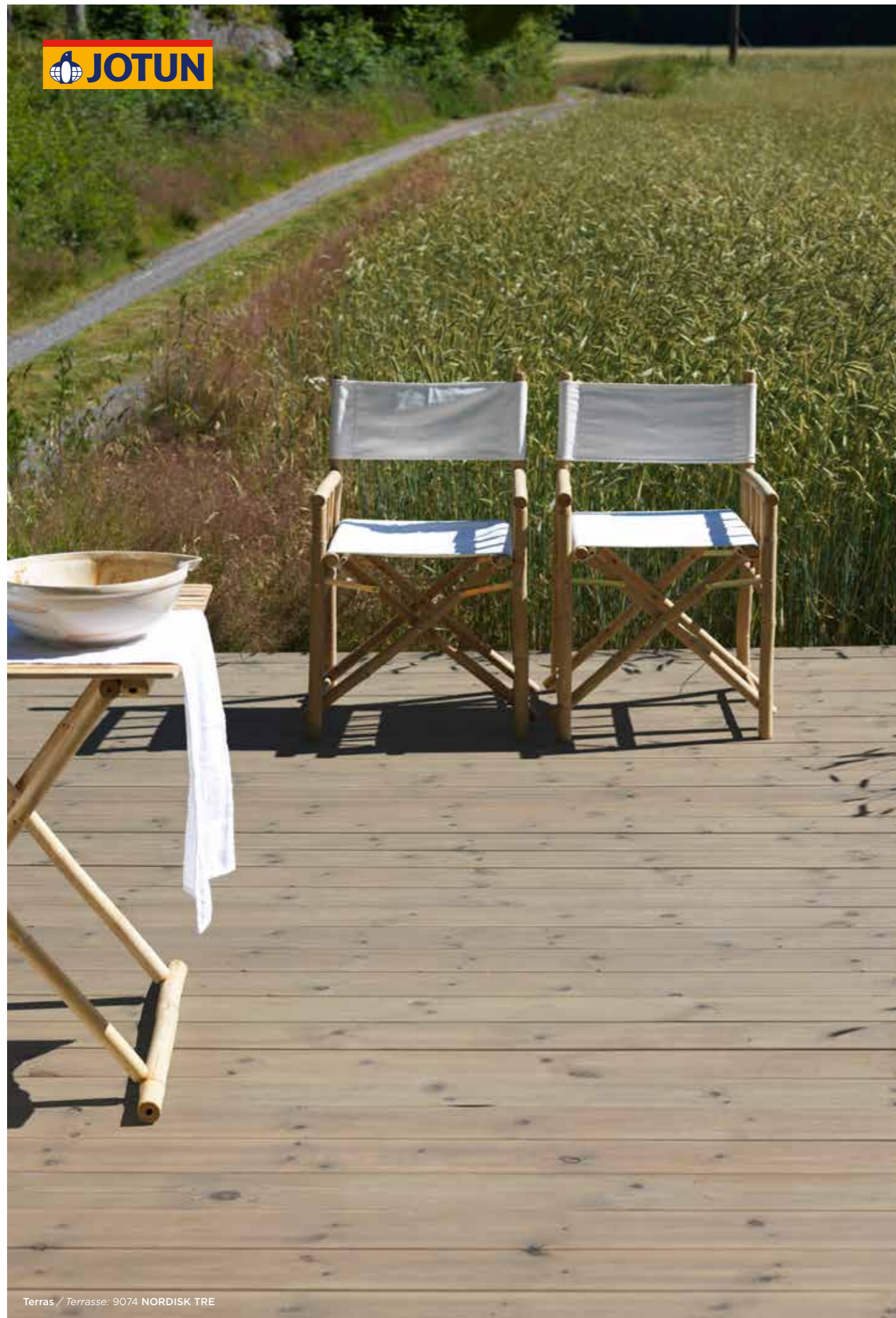
Terras / Terrasse: 9074 NORDISK TRE