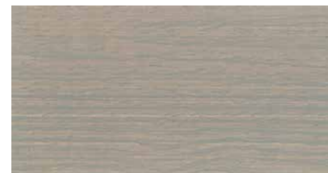
DEMIDEKK 9073 SHIMMERGRÅ