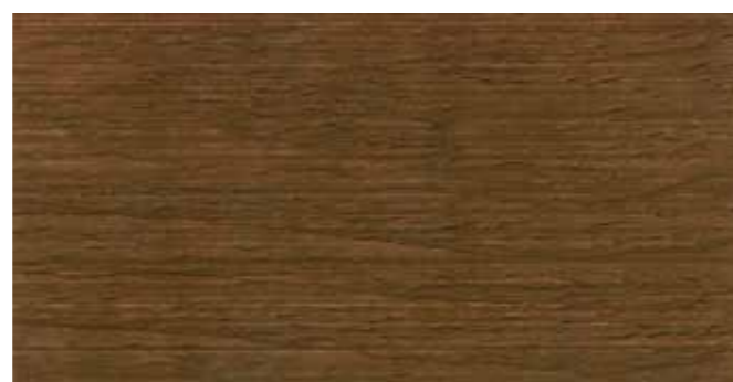
DEMIDEKK 90000 TERRASSEBRUN