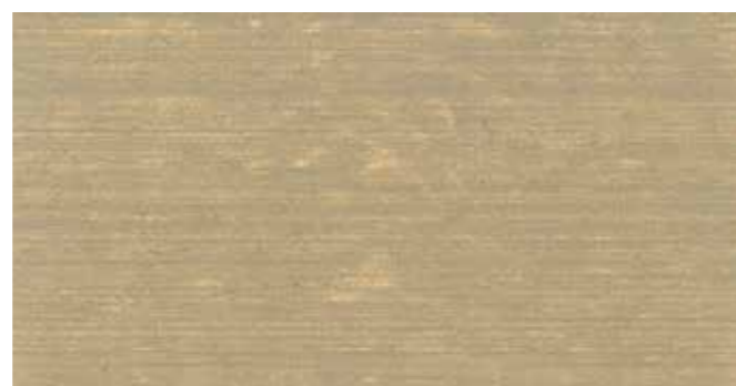
DEMIDEKK 9050 STRÅ

Les couleurs du DEMIDEKK TERRASSLASYR sont conçues pour protéger et décorer les sols en bois tendre des terrasses ou des balcons, des margelles et des escaliers extérieurs. Dans cette carte des couleurs nous reprenons les 12 teintes les plus souvent choisies. D'autres teintes vous sont proposées dans les points de vente Jotun Multicolor.