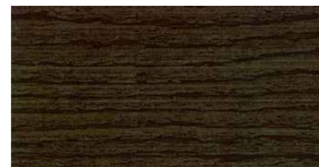
DEMIDEKK 90002 GRÅSVART