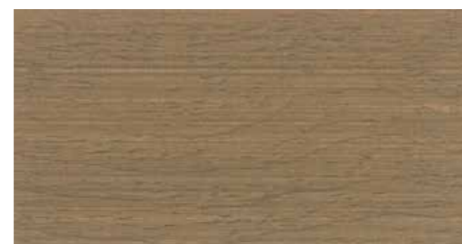
DEMIDEKK 9074 NORDISK TRE