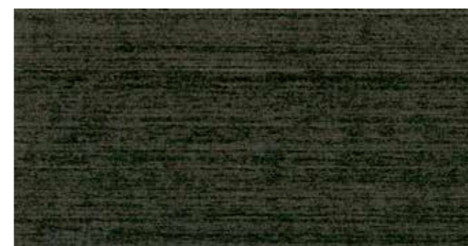
DEMIDEKK 0683 SOTGRÅ