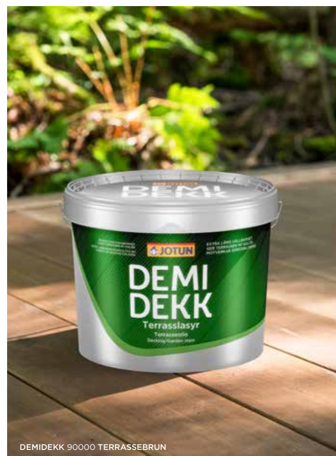
DEMIDEKK 90000 TERRASSEBRUN