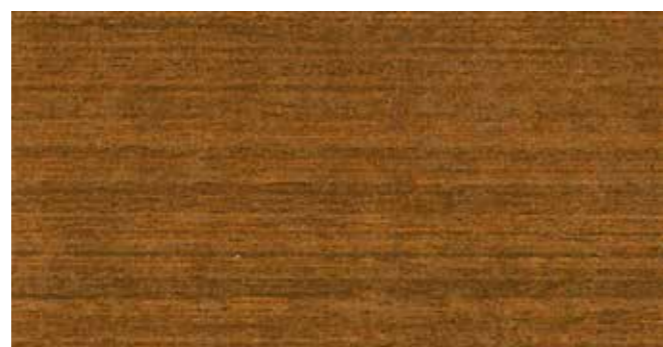
DEMIDEKK 0676 TJÆREBRUN