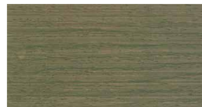
DEMIDEKK 9710 TERRASSEGRÅ