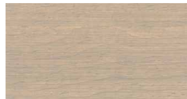
DEMIDEKK 9072 NATURGRÅ