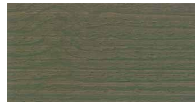
DEMIDEKK 90001 FJELLBRIS