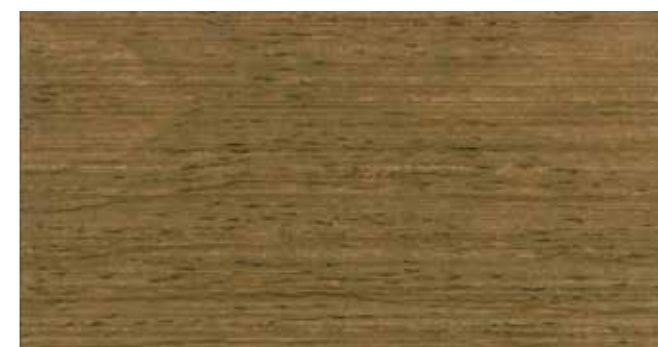
DEMIDEKK 9052 EKSOTISK TRE