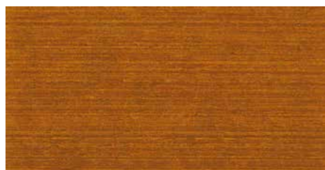
DEMIDEKK 0623 BURMATEAK